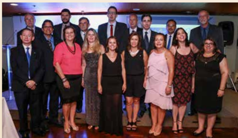
Grupo de Conselheiros e profissionais da Administração à frente do CRA-RS