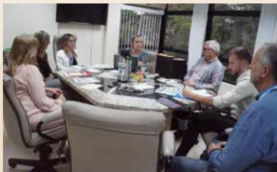
Reunião do Comitê Estratégico do CRA-RS

do fazer diferente e do inovar no sentido de governança dentro da autarquia.