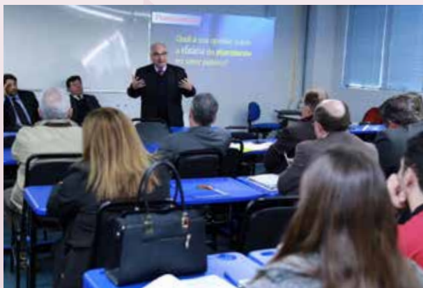
1º Simpósio de Governança Pública Municipal contou com audiência pública, workshop e talk show

Como sequência aos debates, em 2018, o CRA-RS trouxe também ao Estado o Sistema CFA de Governança, Planejamento e Gestão Estratégica de Serviços Municipais de Água e Esgotos - CFA-Gesae.