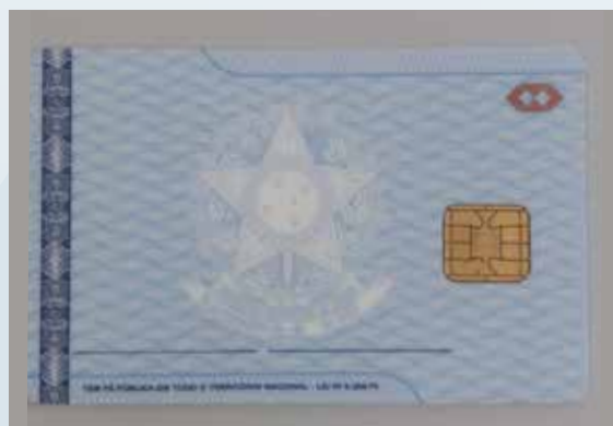
Carteira de Identidade Profissional (CIP) do Administrador

ciais, de serviços, entre outras, além de prefeituras em diversas cidades do Estado e acompanhamento de editais. Esses sistemas também buscam integrar todos os serviços administrativos do CRA-RS, potencializando o trabalho dentro da autarquia e possibilitando aos registrados efetuarem inúmeros tipos de serviços pela internet, como emitir certidões, solicitar o registro profissional e atualizar cadastro, acompanhando as tendências tecnológicas de autoatendimento.