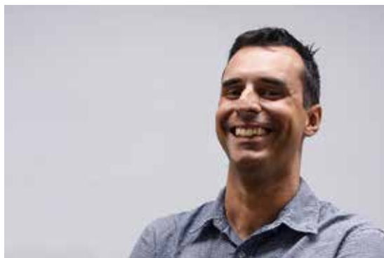
Adm. Gustavo Piardi

ves a serem vencidos neste processo de mudança. “Os principais obstáculos que vejo hoje são gargalos de infraestrutura, a disponibilidade de capital que vem crescendo, mas ainda tem muito espaço para se desenvolver, e a qualificação das pessoas. Hoje ainda temos poucas formações que realmente trabalham as competências necessárias para que a inovação possa se concretizar”, destaca.