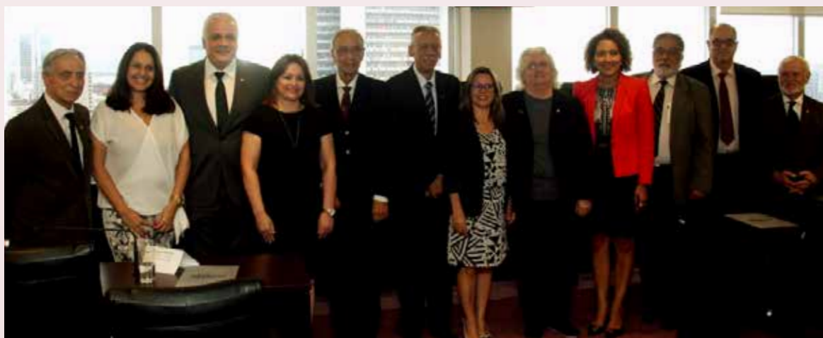
O CRA-RS assumiu a presidência do FÓRUM-RS em dezembro de 2017

discussões que geram conhecimento entre as autarquias que são representadas por seus respectivos presidentes. Em novembro de 2017, foi eleita a nova Diretoria Executiva e Conselho Fiscal do FÓRUM-RS para os próximos dois anos. A eleição contou com a participação de 15 Conselhos Regionais das 27 profissões regulamentadas. O CRA-RS, então