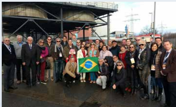
Administradores presentes na Missão Técnica para a Alemanha visitaram a feira de tecnologia Cebit, as empresas Airbus e Volkswagen e participaram do 1º de Seminário Internacional de Gestão Pública

O Conselho também prezou pelas relações internacionais na busca do compartilhamento de conhecimento, a fim de fomentar o desenvolvimento do Brasil e do Estado. Em 2017, em parceria com o curso de Administração da ESPM-SUL, a autarquia