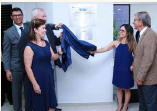
Inauguração das reformas de ampliação e acessibilidade da sede do CRA-RS em Porto Alegre

Em termos de processos, a autarquia também priorizou os princípios da transparência. Trabalhou na reestruturação do setor de licitação, levando em